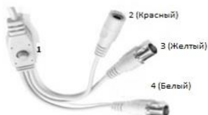
Кабели и разъемы