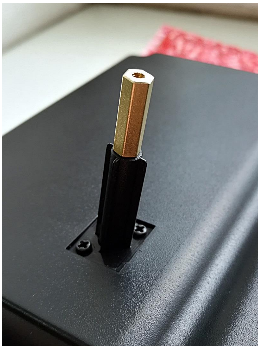
Рисунок 3 - установка стойки в концевик вскрытия