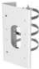
DS-1276ZJ-SUS Крепление на столб