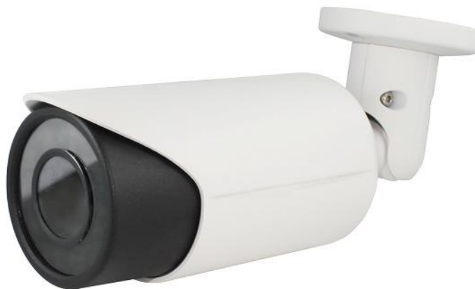
Уличная цветная AHD видеокамера 720P